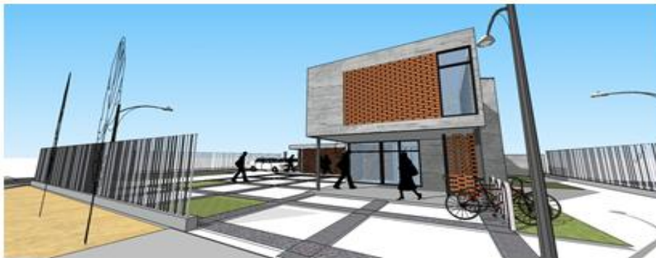
Arquitectura Proyectada_ IMÁGENES 3D