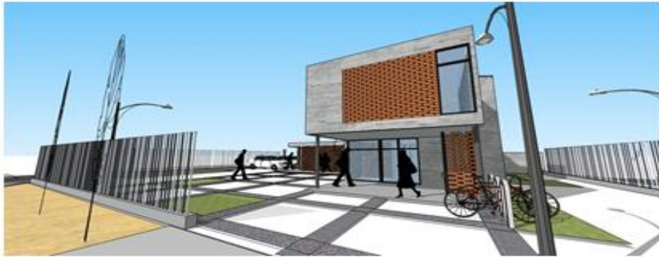
Arquitectura Proyectada_ IMÁGENES 3D