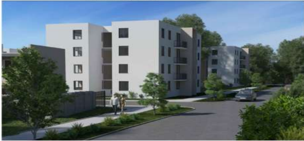
Materialidad: Hormigón Armado. Cantidad: 240 unidades