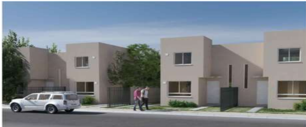
Materialidad: Hormigón Armado. Cantidad: 120 unidades